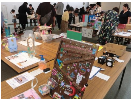
小学校科学作品展